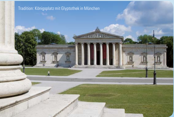
Tradition: Königsplatz mit Glyptothek in München

Dies hilft, Wesentliches vom Unwesentlichen zu unterscheiden und den Überblick in der Informationsfülle unserer Zeit zu bewahren.